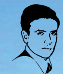
CENTRO STUDI ROSARIO LIVATINO